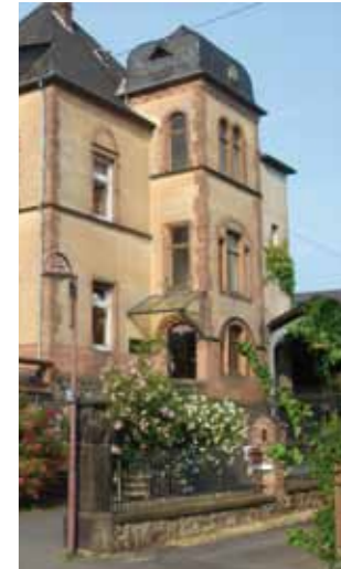
8 www.bitzigeio.com Hof u. Vinothek Weingut Heymann-Löwenstein, Bahnhofstr. 10