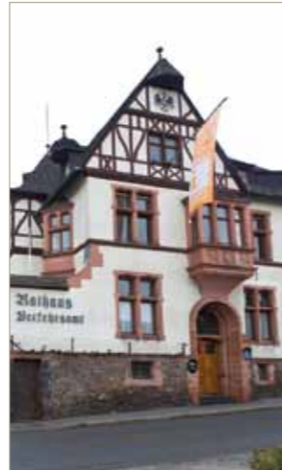
6 www.mollwo.ch/Eidlitz Rathaus August-Horch-Straße 3