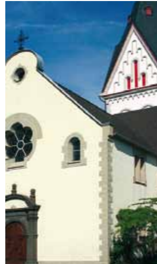
2 www.ulli-boehmelmann.de Evangelische Kirche Kirchstraße