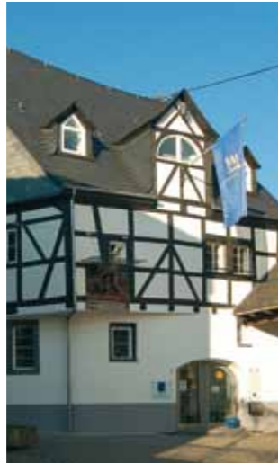
5 www.regina-reim.de Vinothek im Winninger Spital Am Weinhof 2