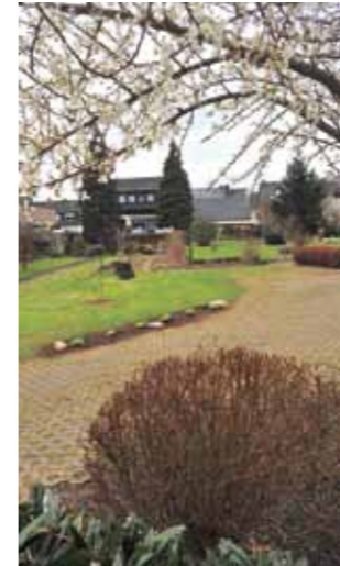
11 www.pilederdergerber.ch Gärten der Häuser Richter/de Leuw, August-Horch-Straße 25