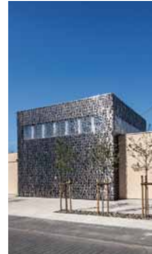
7 www.namtchunmo.com Kubus Weingut Heymann-Löwenstein, Bahnhofstraße 10