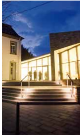
1 www.reinhard-puch.de Evangelisches Gemeindezentrum Kirchstraße 7