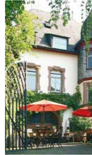
4 www.tilmanzahn.ch Galerie im Kelterhaus Gutsschänke SchAAF, Fährstr. 6