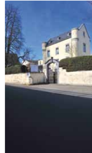
3 www.metanamorph.com Moselufer